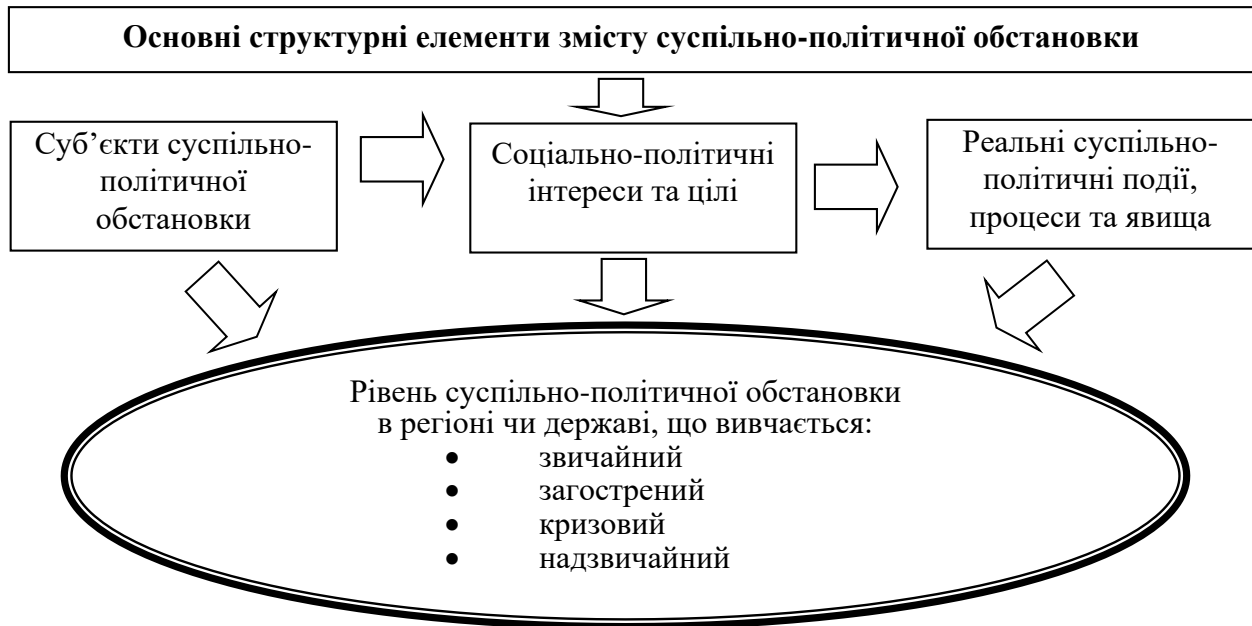
Рисунок 2. Основні структурні елементи суспільно-політичної обстановки, що визначають її рівень

Необхідно акцентувати увагу на тому, що суспільно-політична система будучи відкритою у своєму розвитку проходить перехідні етапи нестабільності, і успішний досвід використання тих чи інших підходів до становлення нової системи суспільних відносин не може гарантувати сталого функціонування суспільно-політичної системи у цілому.