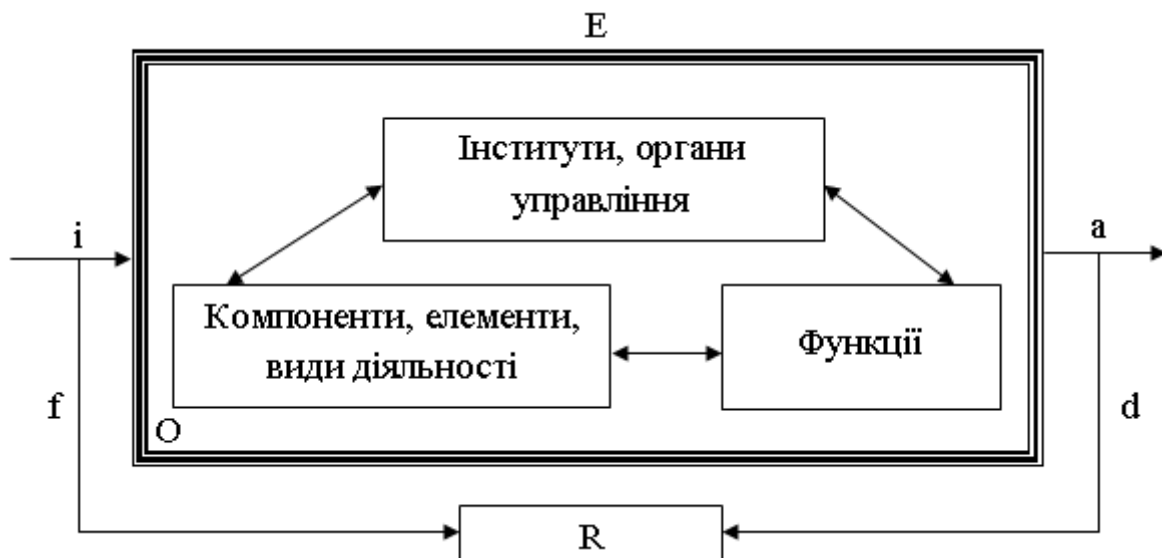
Рис. 3. Схема управління функціональною складовою державного кордону*

екологічна, санітарно-карантинна, природоохоронна, технічна тощо). Другою частковою структурою державного кордону є функціональна, яка представлена головними (фільтрувальна, бар'єрна, контактна), другорядними (відокремлення, регулювання, зіставлення) та специфічними (політична, соціальна, культурна, економічна, психологічна) функціями. Адекватною двом розглянутим вище структурам повинна бути третя – організаційно-управлінська, яка змістовно включає державні інститути з їх ієрархічно впорядкованими системами органів управління, з їх функціональними правовими обов'язками на відповідній території, що реалізує механізм прийняття рішень, від яких залежить досягнення поставлених цілей і кінцевий результат функціонування кордону. Формалізоване системне представлення схеми управління функціональною складовою державного кордону подано на рис. 3.