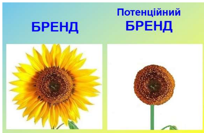
Рисунок 3. Схематичне зображення бренду та потенційного об'єкту бренду

Для вимірювання Дуги Струве було збудовано 265 геодезичних пунктів у десяти країнах, через які вона проходить: Норвегія, Фінляндія, Швеція, Естонія, Латвія, Литва, Росія, Білорусь, Молдова, Україна. Кінцевими пунктами Дуги Струве є геодезичні вимірювальні пункти в Норвегії (Фугленес, біля мису Нордкап) та в Україні (село Стара Некрасівка, біля Ізмаїлу в Одеській області). На кінцевих геодезичних пунктах – в Норвегії та в Україні – збережено монументи, які були встановлені під час спорудження Дуги Струве.