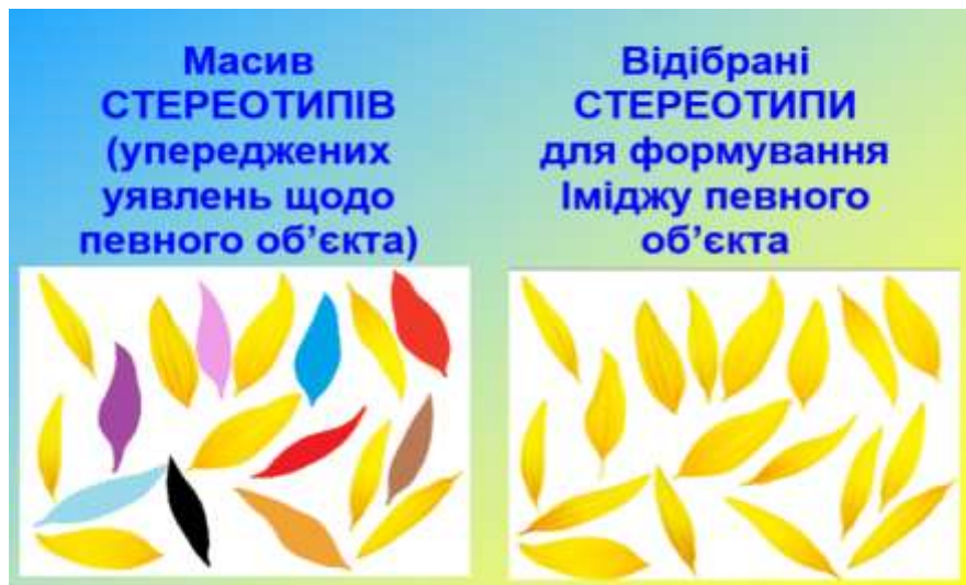
Рисунок 2. Схематичне зображення масиву стереотипів та відібраних для формування іміджу певного об'єкта стереотипів

На рисунку 2 наведено схематичне зображення стереотипів у вигляді розсіпаних квіткових пелюсток на двох картинках. На картинці зліва зображено весь масив стереотипів (спрощених упереджених уявлень) щодо певного об'єкта іміджування у вигляді різнокольорових розсіпаних пелюсток квітів. На картинці справа продемонстровано відфільтрований набір стереотипів. Тобто, із масиву різних спрощених уявлень реципієнтів щодо певного об'єкта відбираються лише ті стереотипи (на картинці це пелюстки однакового кольору), які формуватимуть найбільш ефективний імідж об'єкта.