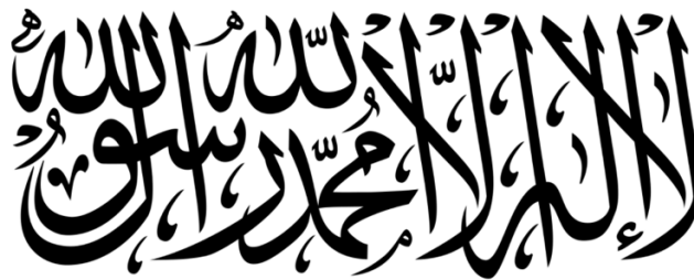
Рис. 1. Шахада, написана на прапорі руху «Талібан» [9]

Факт того, що ідеологією «Талібану» є релігійний націоналізм, не викликає сумніву. На рисунку нижче представлений напис (шахада) на білому прапорі «Талібану» (рис. 1).