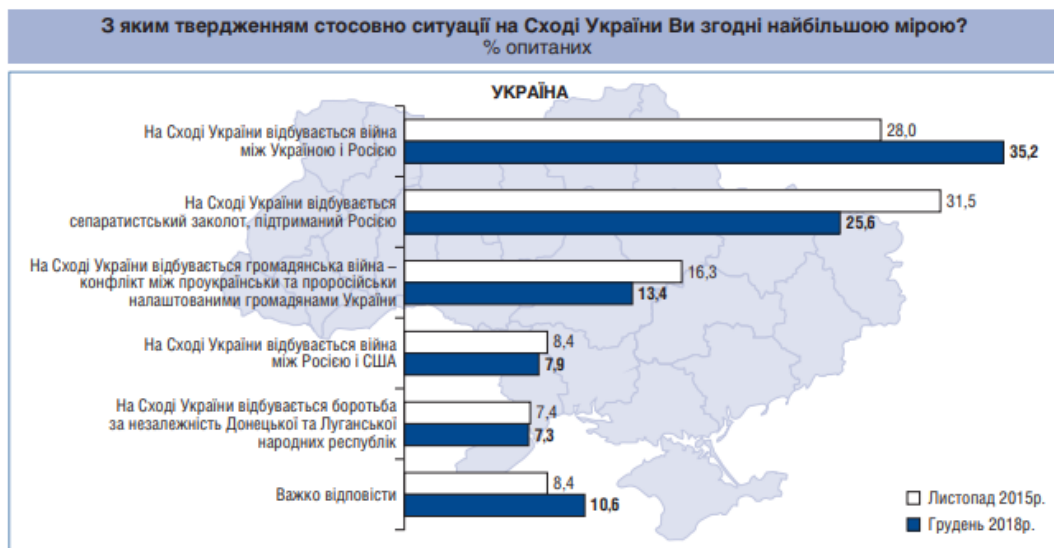
Рис. 1. Ситуація на Донбасі очима громадян України. Соціологічне дослідження Центру Разумкова. Грудень 2018 р. [5, с. 111].

Напередодні президентських виборів 2019 р. аналітик Фонду «Демініціативи» Сергій Шаповалов оприлюднив результати дослідження, відповідно до яких 72% громадян України поділяли думку, що зараз триває війна Росії з Україною [17]. Загрозливими у цьому контексті виглядають погляди мешканців підконтрольної Україні території Донбасу, що розділилися практично навпіл: 39% вважали, що триває війна Росії з Україною, а 40% – що ні [Там само]. А основну провину за збройний конфлікт мешканці підконтрольних територій Донецької і Луганської областей покладали на чинну українську владу (57%), ще 33% звинувачували владу попереднього режиму В. Януковича, 24% – Майдан [15].